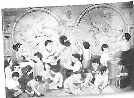
"Los niños del futuro" (1998)